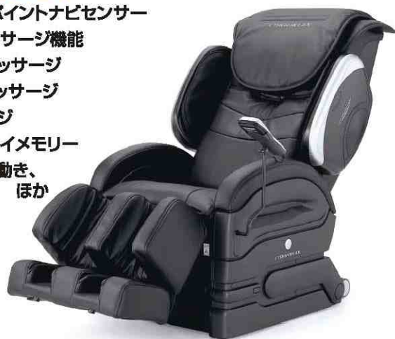
サイバーリラックス