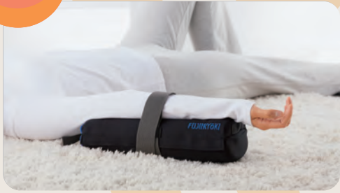
肘から先を止めバンドで固定。机での使用もOK。