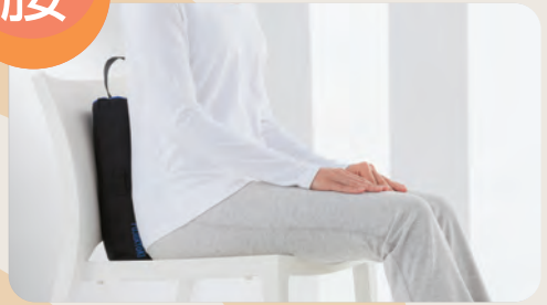
中央の仙骨に当たるように、縦にして使用。