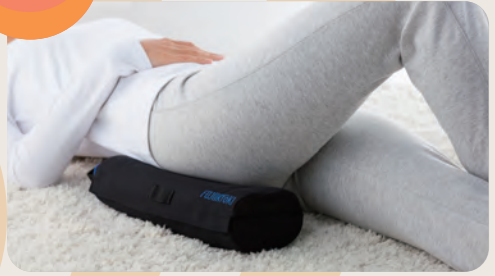
お尻の横部分(大殿筋)に当てて使用。