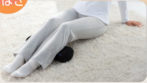
寝た状態で、気になる部分に当てて使用。