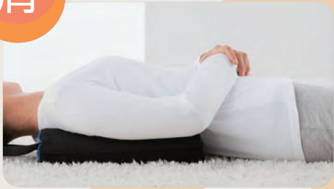
背から横脇に当たるように、縦にして使用。