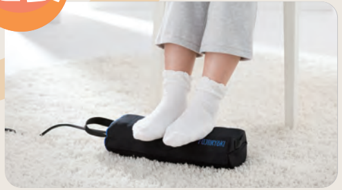
椅子または床に座り、本体に足裏を当てて使用。