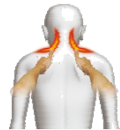
ループもみ上げ動作イメージ

また、「リラックスソリューション SKS-2650」には、家族一人ひとりが自分の体調に合わせて、日常、使っていただけるように、自動コース数を17種類搭載しています。さらに、中・高年層が簡単に使っていただけるように、ワンタッチで自動コースが始まる「ワンタッチ自動コース」もご用意しています。