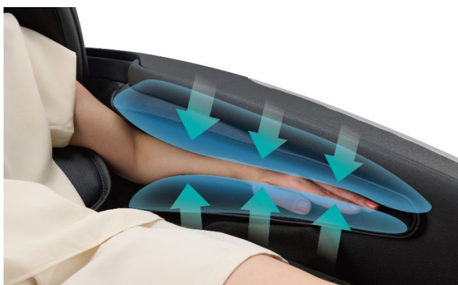
腕部エアーマッサージの新しいデザイン

新形状の腕部エアーマッサージは、よりリラックスした姿勢で体感いただけるように手のひらを下向きに置く方式に改善の上、前腕から指先までエアバッグが包み込み、よりホールド感を生み出すような設計としています。