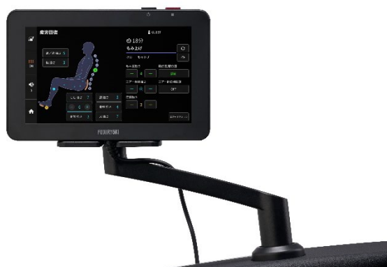
8 インチの大型タッチパネル