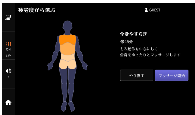
疲労度から選ぶ(人体イラストで部位ごとの疲労度を選択)