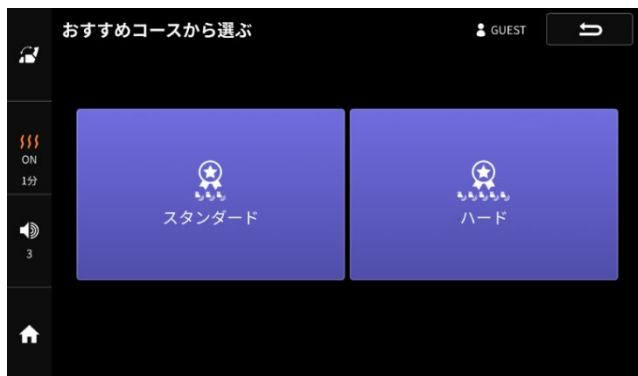
2 種類のおすすめコース

また、全てのコースマッサージの強さレベルは指型のマークの数で示しており、当社のマッサージチェアを初めてお使いいただく方にも一目で分かりやすくなりました。