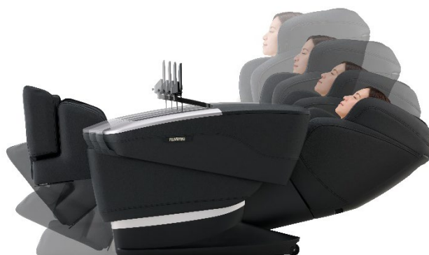
背もたれは約 164 度までリクライニング