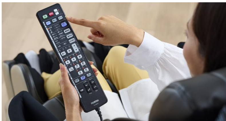
簡単ワンタッチで強弱調節

ボタン一つでメカマッサージとエアーマッサージの強弱設定を行う「ワンタッチ強弱モード」を搭載しています。強さは「ソフト」「バランス」「ハード」の 3 段階で調節が可能です。なお、各部位のマッサージの強さは個別での調節も可能です。また、エアーマッサージの強さだけを一括で 3 段階の調節ができる「エアー強さ一括調節」を新搭載しました。