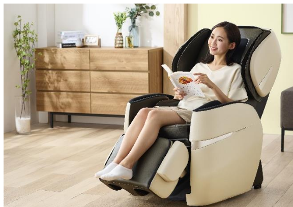
ソファスタイル(フットレスト状態)

座面は前方にスライドしながらリクライニングするため、約 15 cm の後方スペースでフルリクライニングが可能です。マッサージを使用していない間は、お部屋の雰囲気を邪魔しないよう脚部を反転させフットレストにすることで、ソファとしてもご使用いただけます。