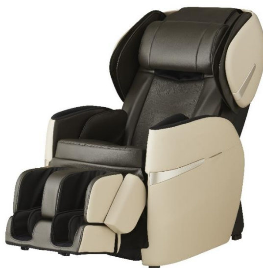
ベージュ×ブラウン(CB)

このたび発売した「AS-R620」は、充実した機能とコンパクトサイズが人気の「リラックスマスター」シリーズの最新モデルです。「ワンタッチ強弱モード」や「エアー強さ一括調節」の新しい機能を搭載し、簡単に自分好みのマッサージの強さに調節できるよう、ユーザビリティを向上させました。