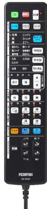
LED ダイレクトリモコン