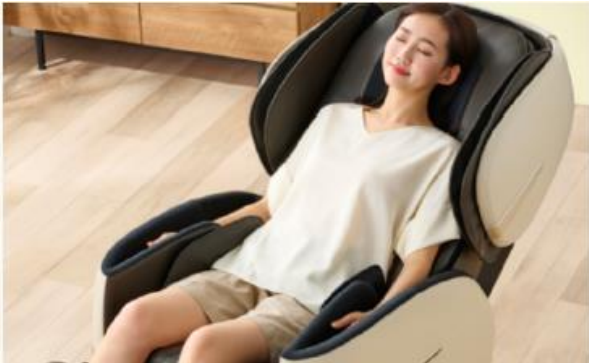
ゆったりとしたエアーコース

座面の両側には「大型もも横エアーバッグ」を新たに搭載しています。腰まわりや太ももの大きな筋肉を引き締めるように圧迫し、疲れをほぐします。