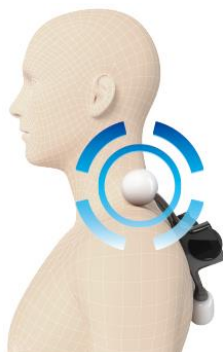
3段階の肩位置調節