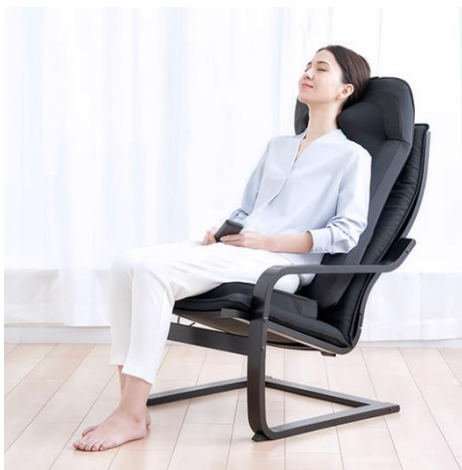
椅子に乗せて座ってマッサージ