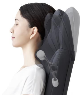
肩位置ぴったりフィット

肩マッサージの深さを調節するため、手動でヘッド部分の角度を 3 段階に調節できる「肩位置ぴったりフィット」を搭載しています。座面クッションは身長に合わせて着脱可能です。また、背パッドを着脱してマッサージのフィット感をさらに調節できます。