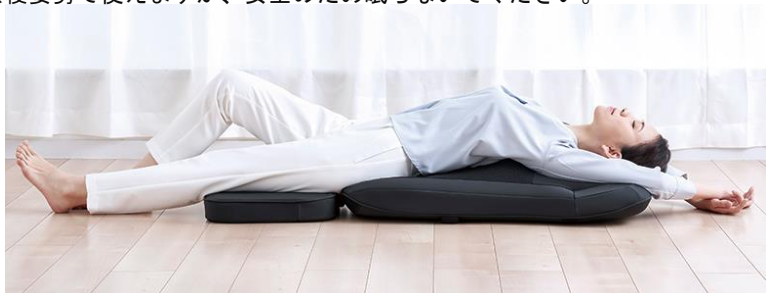
寝姿勢でのマッサージ