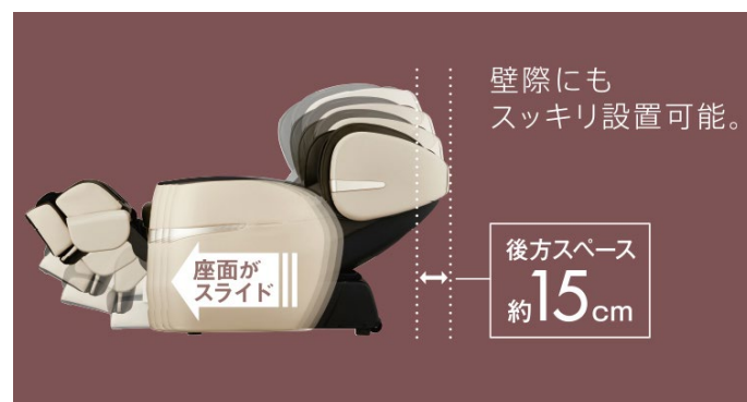
壁際でも気にせずフルリクライニング