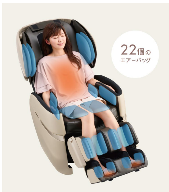
全身エアーマッサージ

※ 当社製品 AS-R600 比較(大きさは表面積、膨らみは無負荷状態で給気したときの高さで比較)