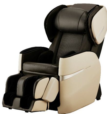
ベージュ×ブラウン(CB)

マッサージチェアに求められるニーズは多岐にわたります。部屋の空間との融和性があるデザインと、充実したマッサージ機能を兼ね備えた「リラックスマスター」シリーズは、2009年の発売から長く人気を集めています。