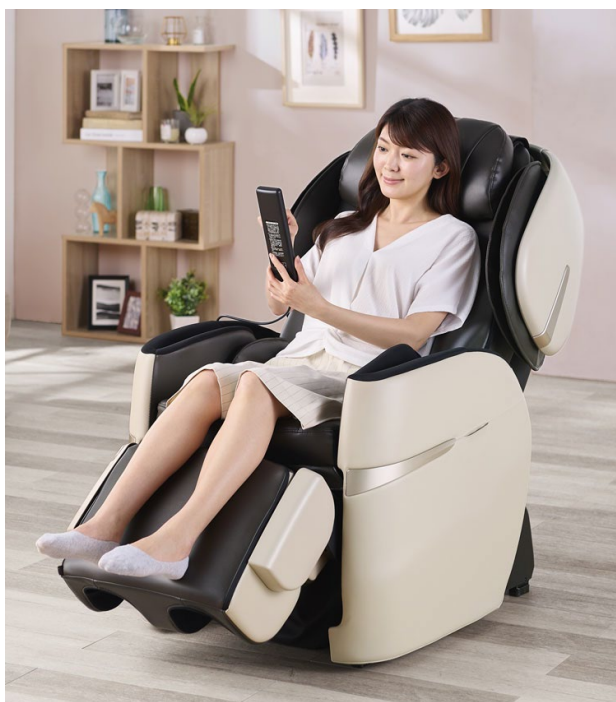
肩部収納とフットレストでソファスタイルに

リクライニングする際は座面が前にスライドしながら背もたれが倒れる「スライドリクライニング機能」を搭載していますので、後方スペース約 15 cmあればフルリクライニングすることができます、限られたスペースを有効的に活用することができます。