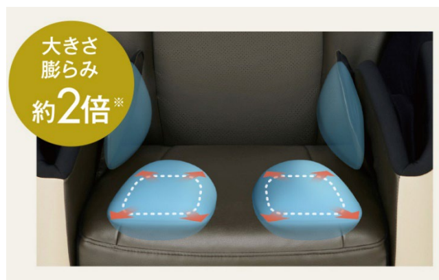
大型座面エアバッグ