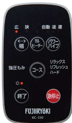
コースの選択もしやすい 操作パネル

足裏とふくらはぎ部のそれぞれのパーツの布カバーは取り外して手洗い可能で、清潔に保つことが可能です。