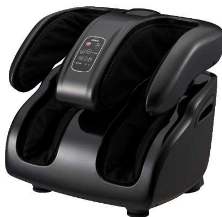
モミーナ フットマッサージャー KC-330

美と健康の総合メーカー、株式会社フジ医療器(本社:大阪府大阪市)は、ふくらはぎ部のマッサージ機構を太もも位置まで5段階で角度調節が可能な「ラチェットウイング」を新搭載し、足裏から太ももまでパワフルにマッサージを行う「モミーナ フットマッサージャー KC-330」(以下、KC-330)を2022年2月5日に発売いたします。メーカー希望小売価格はオープン価格、全国の家電量販店を通じて販売いたします。