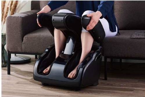
ふくらはぎから太ももまで対応 「ラチェットウイング」

ふくらはぎ部のマッサージ機構「ラチェットウイング」は、ふくらはぎから太ももまでのマッサージ位置を、手動で5段階の位置調節ができます。ふくらはぎ下・上、ひざ下・上、太ももの5つのポイントに移動させ、それぞれのポイントで集中ケアができます。