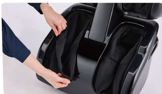
足裏とふくらはぎ部の布カバーは 取り外して手洗い可能