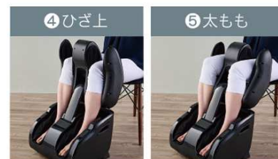
ふくらはぎ下から太ももまで 5か所をマッサージ