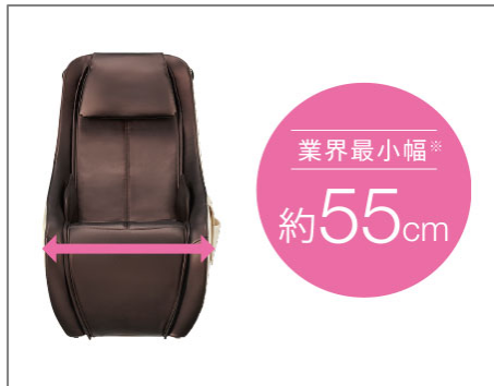
搬入経路の幅が気にならない コンパクト設計