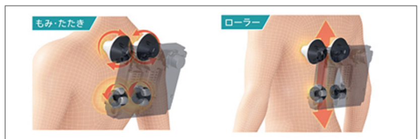
「もみ・たたき」と「ローラー」の 2 種類のもみ技から選択可能