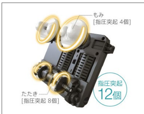
もみ用とたたき用のもみ玉を採用した マルチムーブメカ

もみ技はもみとたたきを組み合わせた「もみ・たたき」と、伸ばすようにマッサージする「ローラー」から選択可能で、付属の調節パッドでマッサージの強さを調節できます。