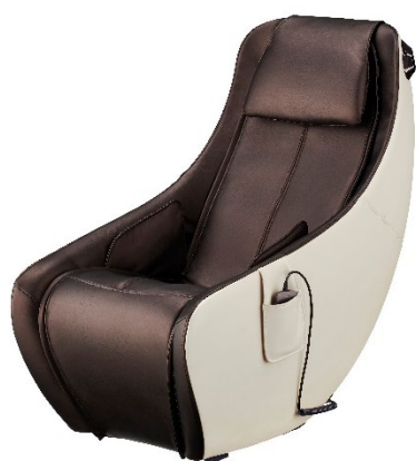
ベージュ×ブラウン(CB)

美と健康の総合メーカー、株式会社フジ医療器(本社:大阪府大阪市)は、コンパクト設計でインテリア性の高いデザインと背中~もも裏までの広範囲をマッサージする独自機構「マルチムーブメカ」を搭載したマッサージチェア「ルームフィットチェア グレイス AS-R500」(以下、AS-R500)を2021年4月10日に発売いたします。メーカー希望小売価格はオープン価格、全国の家電量販店を通じて販売いたします。