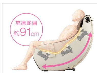
背中からもも裏まで広範囲にほぐす「ロングストロークマッサージ」

L 字型のフレームを採用することで、施療範囲約 91cm を実現した「ロングストロークマッサージ」で、背中からもも裏まで広範囲にもみほぐします。動作範囲は「全身」、「上半身」、「下半身」から選択できます。