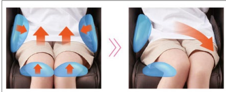
骨盤まわりをひねるようにマッサージする 「エアーストレッチマッサージ」