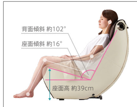
座面傾斜をつけることで よりリラックスした座り心地に