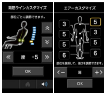
「ユーザーカスタマイズモード」のリモコン設定画面の一部