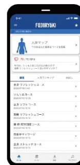
気分や疲労度でおすすめのコースを提案する「アプリモード」