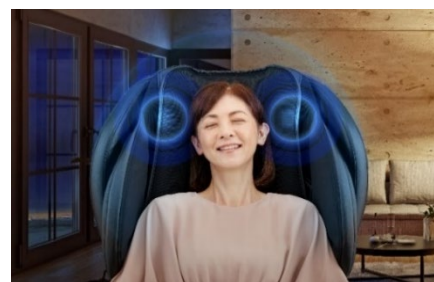
臨場感のあるサウンドに包まれながらマッサージが可能

マッサージチェアに座る人専用設計、搭載された Bluetooth®対応スピーカーは、フルレンジの DSP 内蔵デジタルスピーカーで立体的なサウンドと表現豊かな音域出力を実現、まるで劇場にいるかのような臨場感あるサウンドに包まれながらマッサージを行うことができます。(スピーカーのみでも使用できます。)