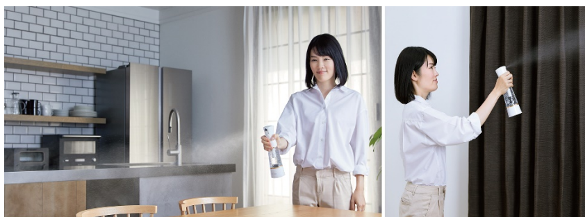
使用シーンイメージ

従来から使用されている多くの除菌・消臭スプレーは薬剤やアルコールを含むため人体への影響が危惧されています。新発売のトレビ・クリアゼロは、オゾンの空気を浄化する自然由来の酸化作用に着目し、においや菌の原因物質を瞬時に除菌・消臭するオゾン水を生成します。オゾン水はご使用後に自然に水と酸素に変わるため、残留性もなく無害で安全でありながら、薬品やアルコールを使用せず、ご自宅の水道水と電気だけで繰り返し生成でき、経済的で環境にもやさしい商品です。キッチンやリビング、バス・トイレや玄関の空間はもちろん、カーテン・カーペットのような布製品、においが気になる靴・ブーツや下駄箱の消臭、まな板・包丁といった衛生面で気を付けたいアイテムなど家中の除菌・消臭にお使いいただけます。