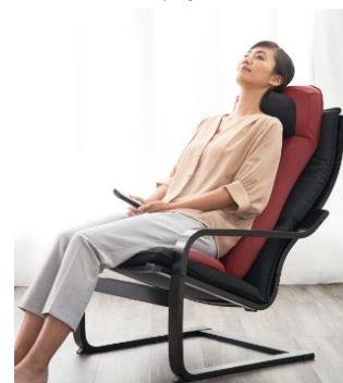
椅子に乗せて、チェアスタイルでのマッサージ 写真の椅子は別売品です。