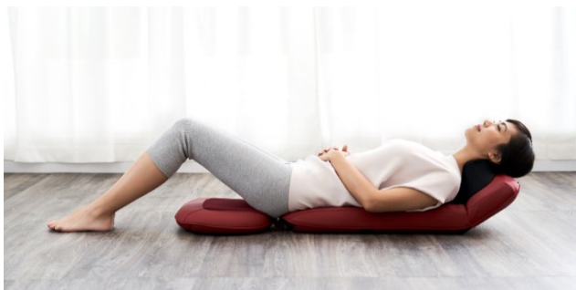
寝姿勢になったフラットスタイルでのマッサージ

MRL-1200では、床やベッドに置いてフラットな状態にし、その上に寝姿勢になることで体圧をかけたマッサージを味わうことが可能となり、よりリラックスした姿勢でマッサージをお楽しみいただけます。首・肩と背中・腰に2つの専用メカを搭載した新開発の「ダブルメカ」で、従来製品では60cmだった施術範囲が、業界最大※75cmまで大幅にワイドになりました。6つのもみ玉で首と肩をつかむようにほぐす「首肩つかみもみメカ」と、肩甲骨から腰まで広範囲のコリをもみほぐす「背腰メカ」は、それぞれの部位に最適化されたマッサージを実現しています。さらに、体へのフィット性を高めるために、首・肩の高さに合わせてヘッド部を3段階に角度調節する「肩位置フィット機構」と、座った状態でのマッサージ時に、身長に合わせて調整できる「着脱式座面クッション」を搭載しています。カラーは、レッド、ネイビー、ブラックの3色からお選びいただけます。