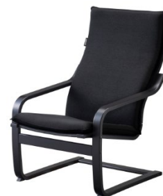
シートマッサージャー用専用イス MRL-10C