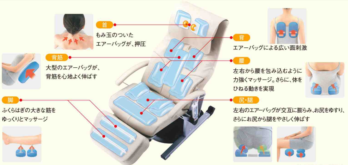
※イラストはすべてイメージ図です。

17個のエアバッグの独立した動きの組み合わせで、体のそれぞれの部位に合った、多彩なマッサージを行います