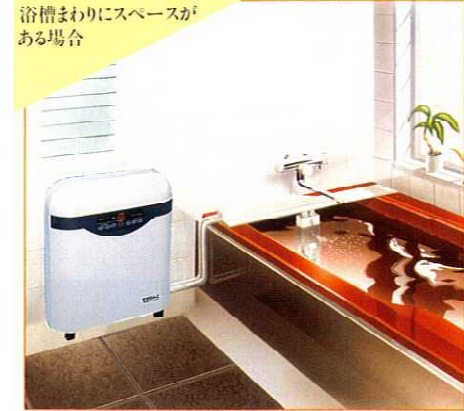
浴槽まわりにスペースがある場合