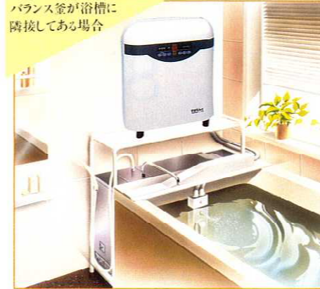
バランス釜が浴槽に隣接してある場合