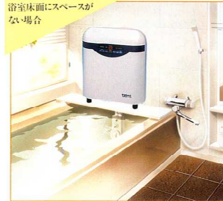
浴室床面にスペースがない場合